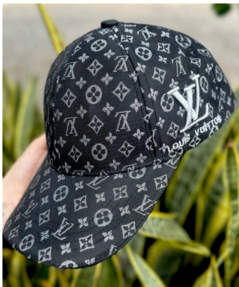
Gorra LV MultiLogo