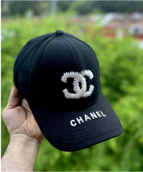
Gorra Chanel Negra