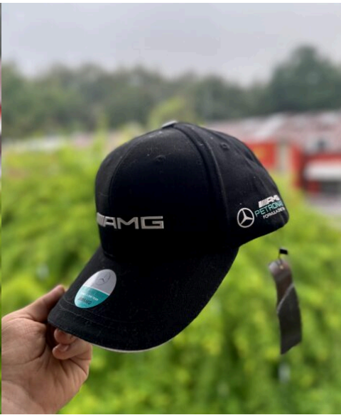
Gorra AMG Negra