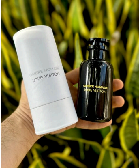
Perfume Ombre Nomade