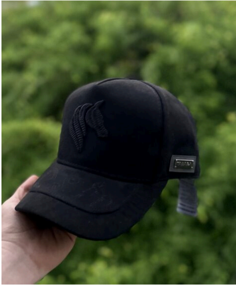
Gorra Caballo Tasara Negra