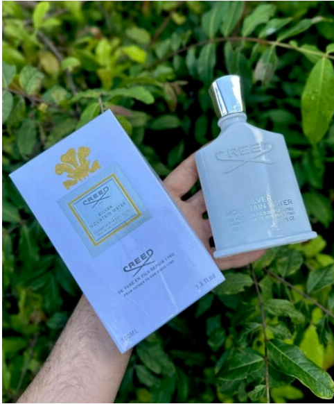
Perfume Creed Silver