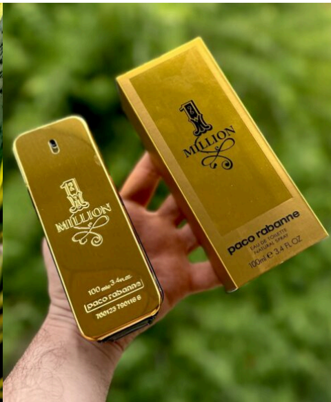
Perfume One Million