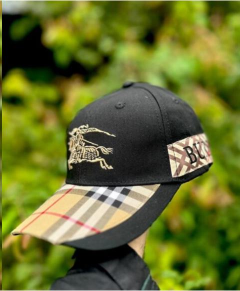
Gorra Burberry Negra con Dorado