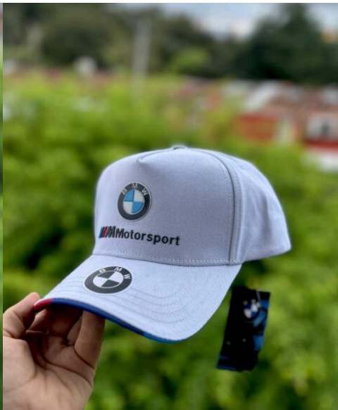
Gorra Burberry Mitad Estampado Gorra BMW Blanca