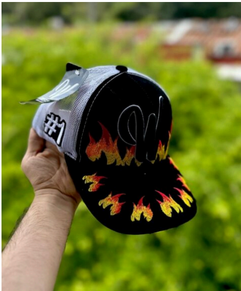
Gorra W Merch Llamas