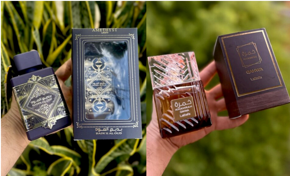
Perfume Lattafa Amethyst