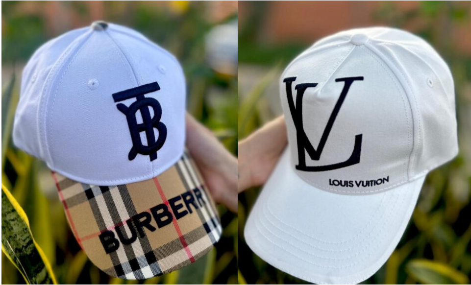
Gorra Burberry Blanca Gorras LV Blanca detalle Café