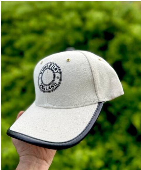
Gorra Burberry England Gorra Prada Gris Blanca