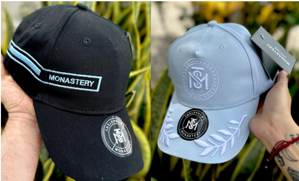
Gorras MST Negra con Gorras MS Azul Claro detalle Azul Claro