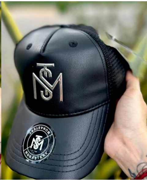
Gorra MST Tipo Cuero Negra