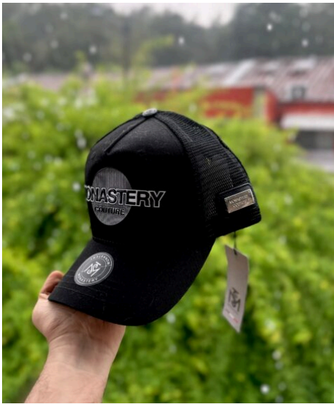
Gorra Monastery Exclusiva Negra