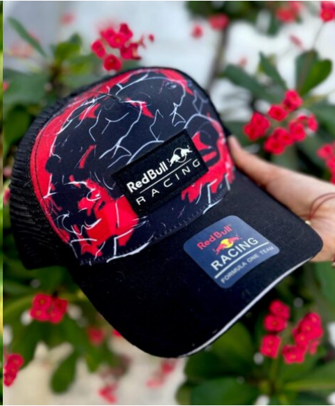
Gorra RedBull Negro detalles Rojos