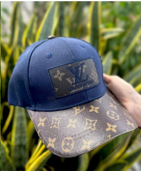
Gorra Lv Azul y Café