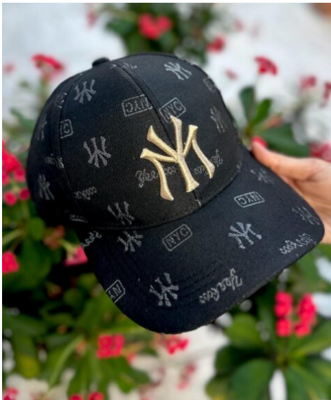
Gorra New York Negra detalle dorada