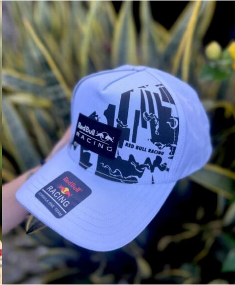
Gorra Redbull Blanca