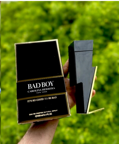
Perfume Bad Boy