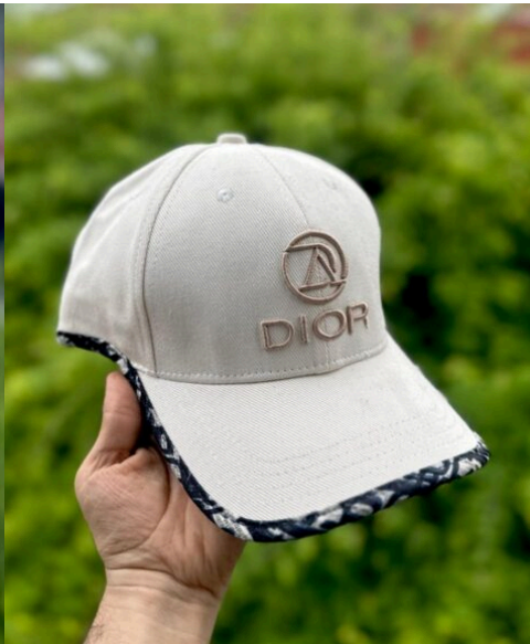
Gorra Dior Exclusiva Blanca