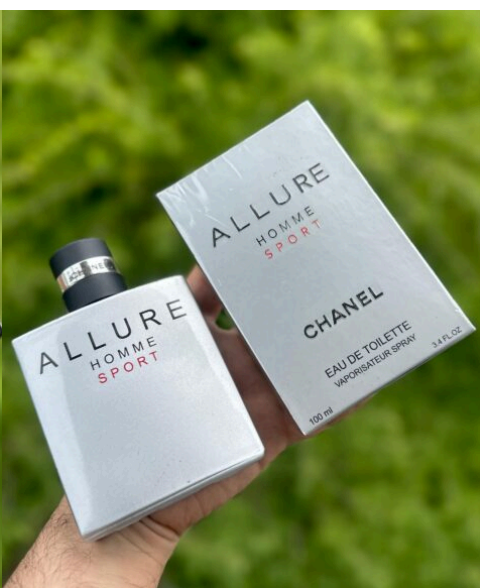
Perfume Allure Home Sport