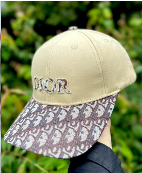
Gorra Dior Beige