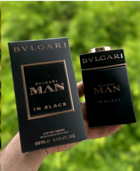
Perfume Bvlgari Man in Black