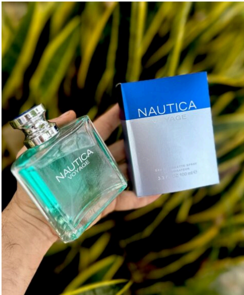
Perfume Náutica Voyage