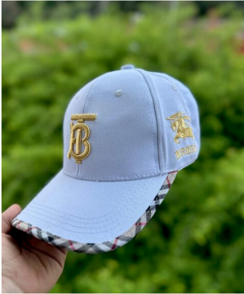
Gorra Burberry Blanca Dorado