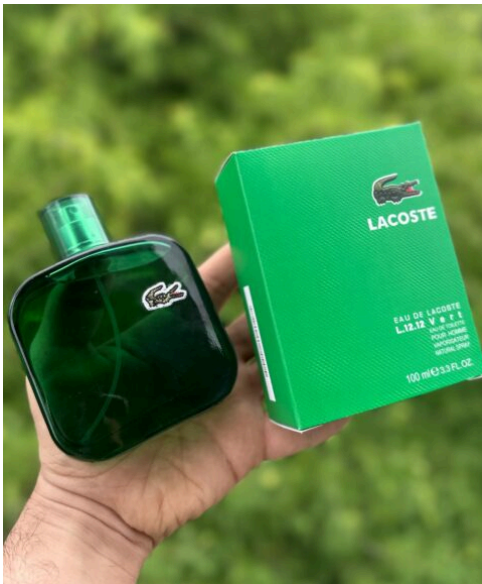
Perfume Lacoste Vert