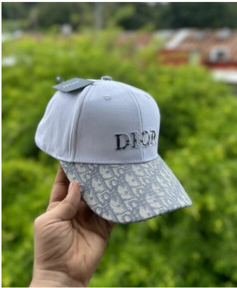
Gorra Dior Blanca Camuflada