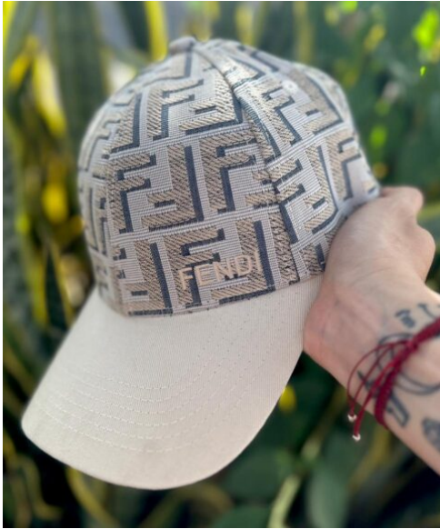
Gorra Fendi Beige detalles