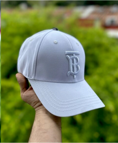
Gorra Burberry Blanca