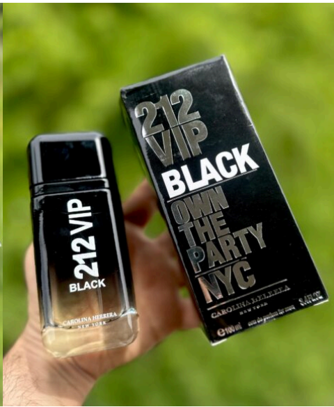
Perfume 212VIP Black