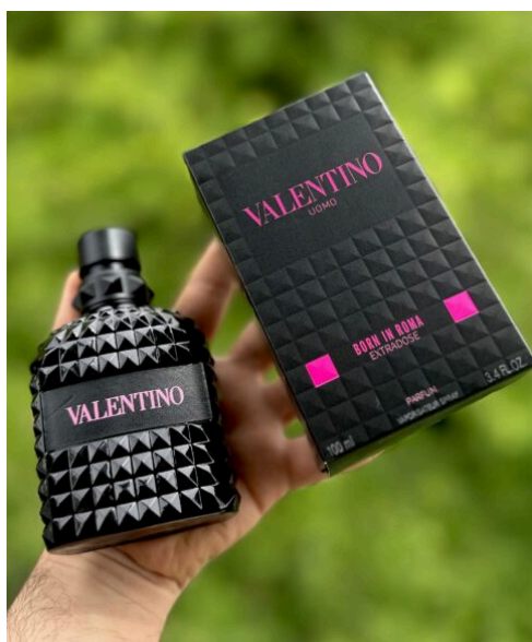
Perfume Valentino Extrados