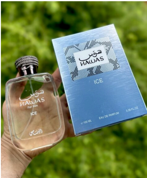
Perfume Hawas Ice