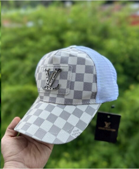
Gorra LV Café y Gris Maya Blanca