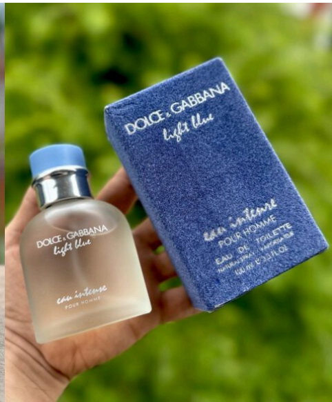
Perfume Light Blue Intense