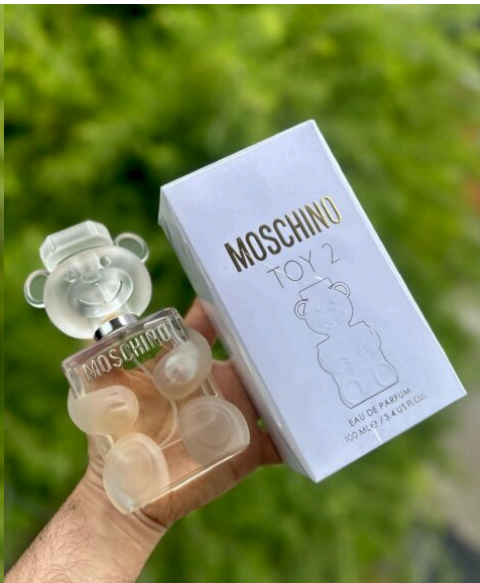
Perfume Moschino Toy 2