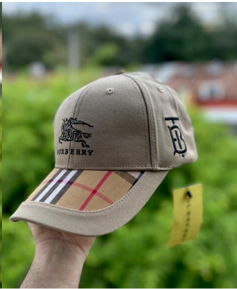
Gorra Burberry Exclusiva