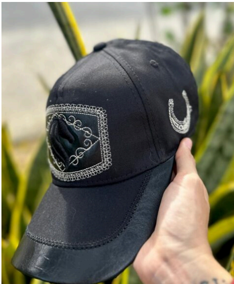
Gorra Caballo en la mitad