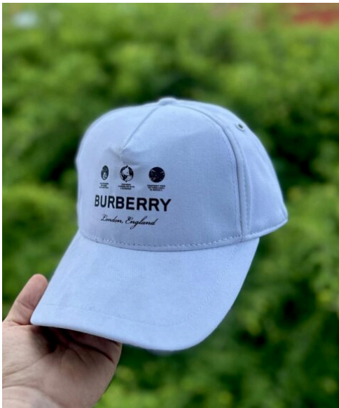
Gorra Burberry Blanca