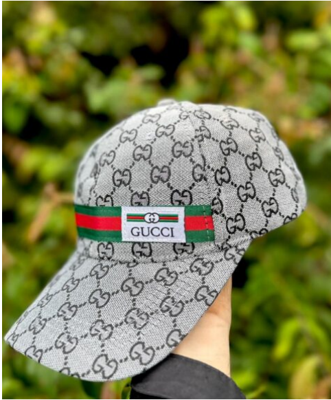
Gorra Gucci Gris