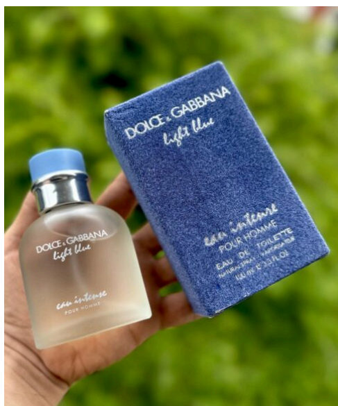
Perfume Light Blue Intense