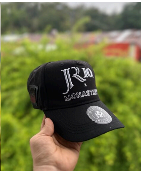
Gorra Monastery x JR10