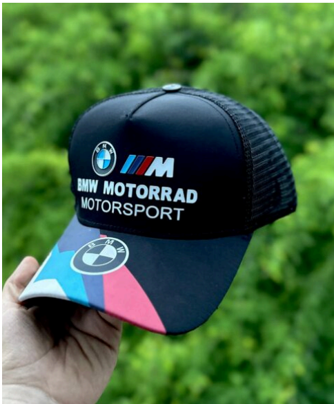
Gorra BMW Multicolor