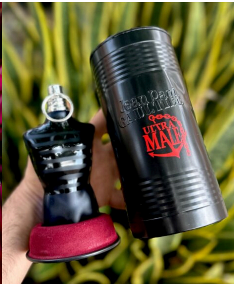
Perfume JP Ultra Male