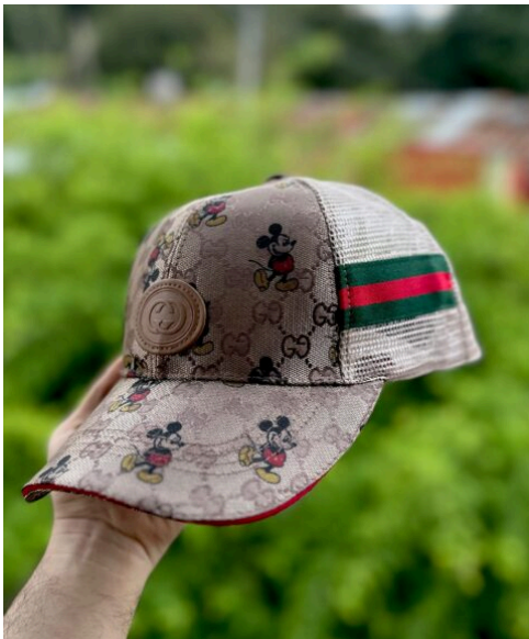
Gorra Gucci Mickey