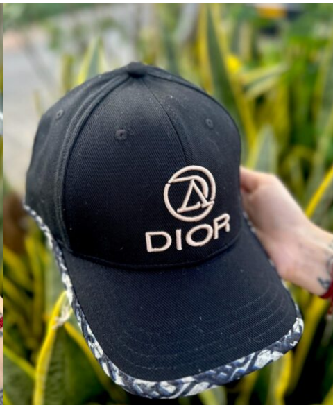
Gorra Dior Exclusiva