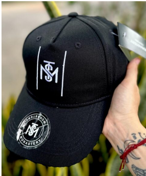
Gorra MST Exclusiva Negra