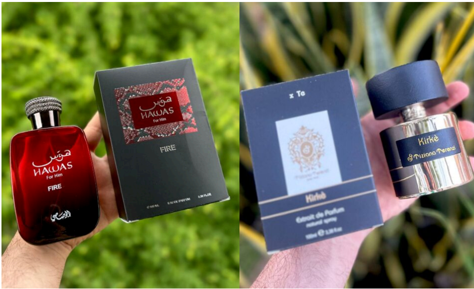
Perfume Hawas Fire