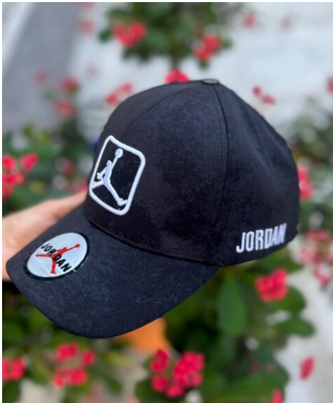
Gorra Jordan Negra