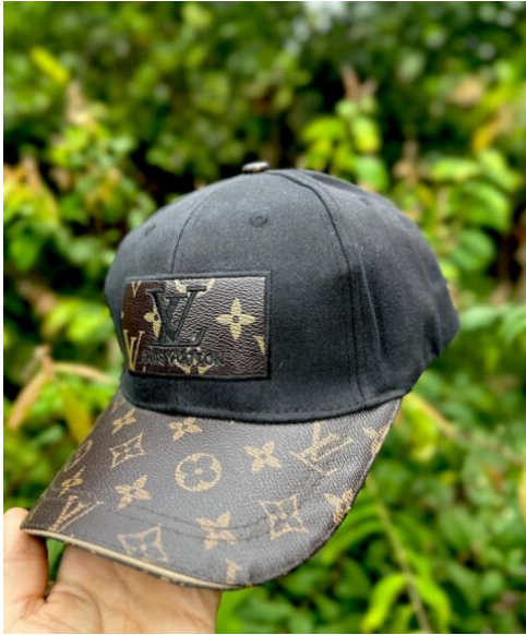
Gorra LV Café Oscuro