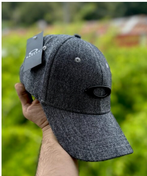
Gorra Oakley Gris