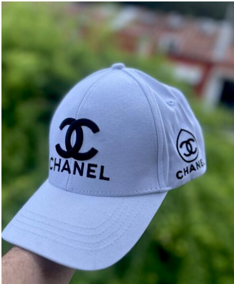
Gorra Chanel Blanca