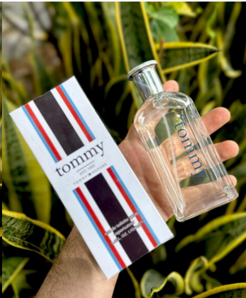
Perfume Tommy Men