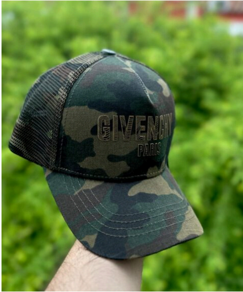
Gorra Givenchy Camuflada