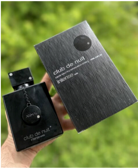
Perfume Club de Nuit Intense