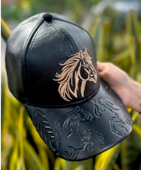
Gorra Caballo Grabado Negro