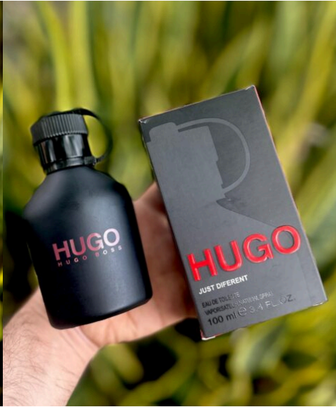
Perfume Hugo Boss Different