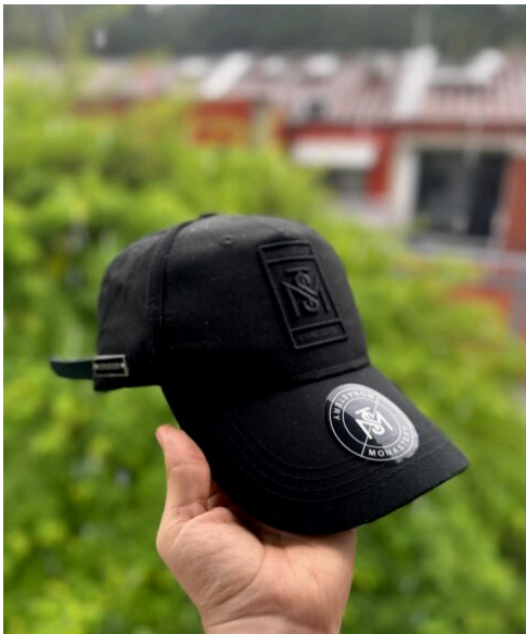
Gorra Monastery Toda Negra