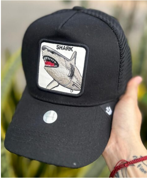
Gorra Shark Tiburon