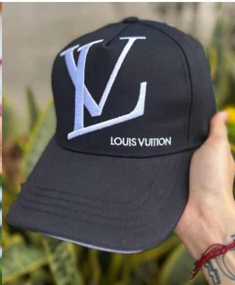
Gorra XI Negra Clasic