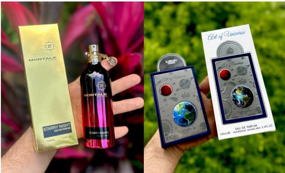
Perfume Montale Starry Night