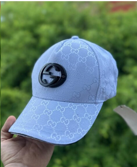
Gorra Gucci Blanca