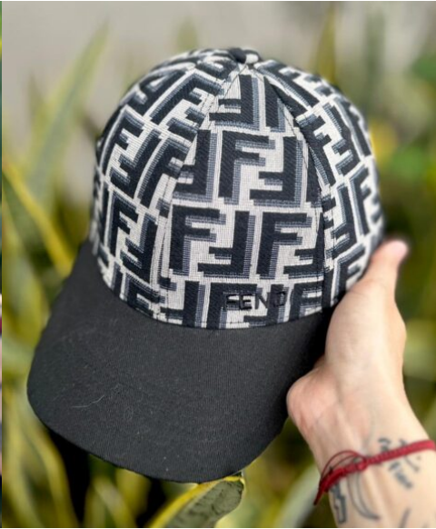
Gorra Fendi Negra detalles