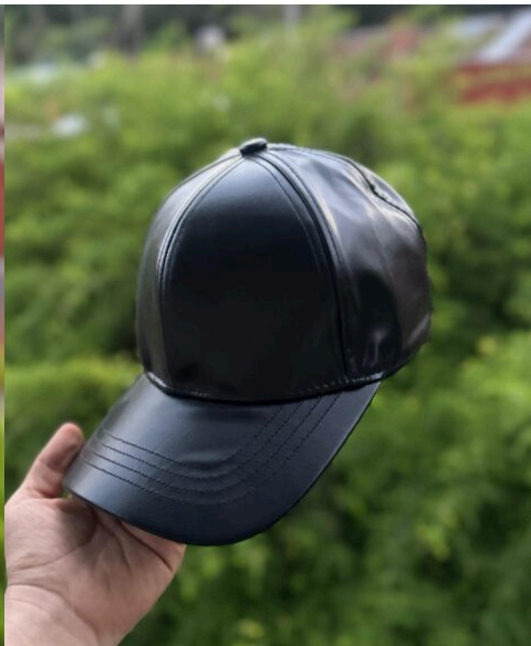
Gorra All Black