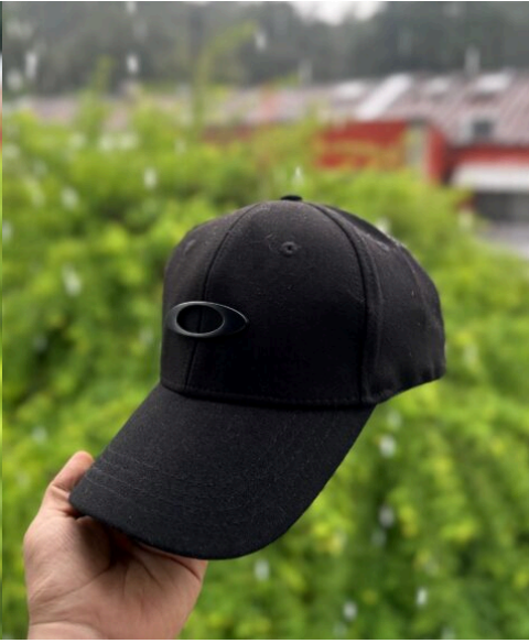
Gorra Oakley Negra