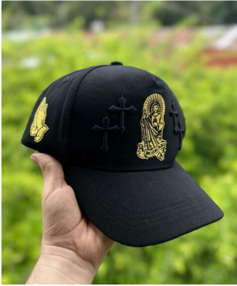
Gorra Jesús Negra