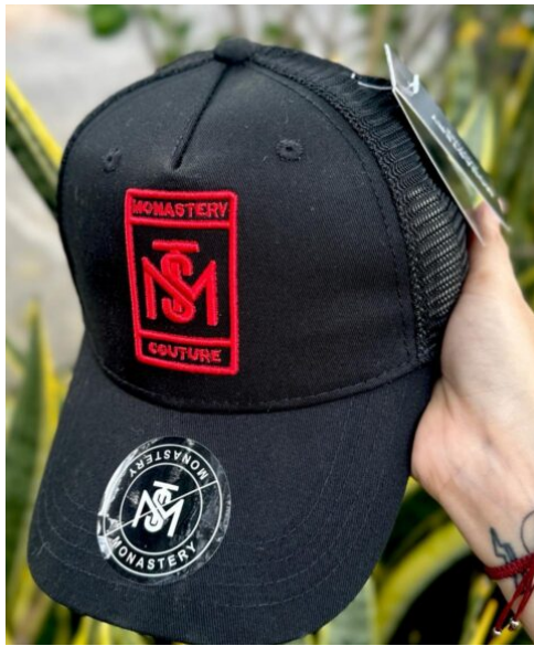
Gorra MST Negra detalles Rojos