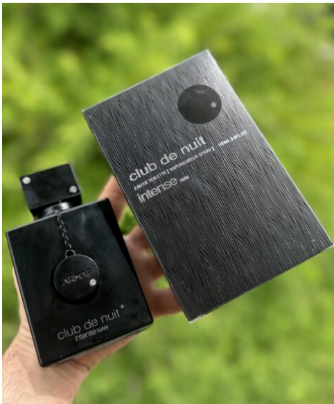
Perfume Club de Nuit Intense