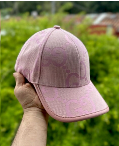
Gorra Gucci Rosada