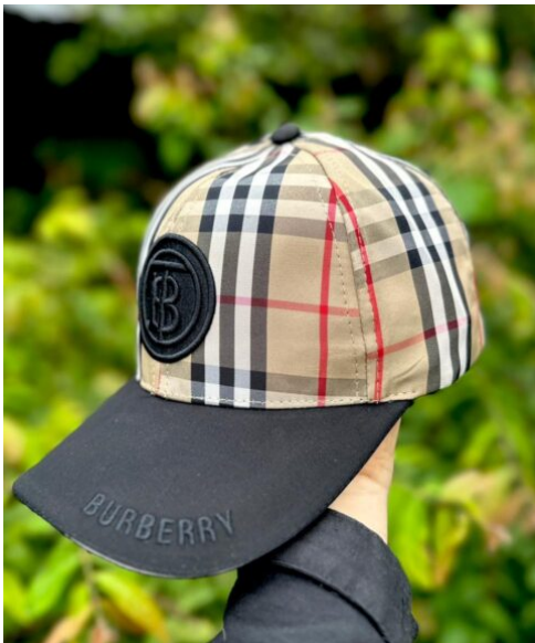
Gorra Burberry Tonos Tierra oscuros