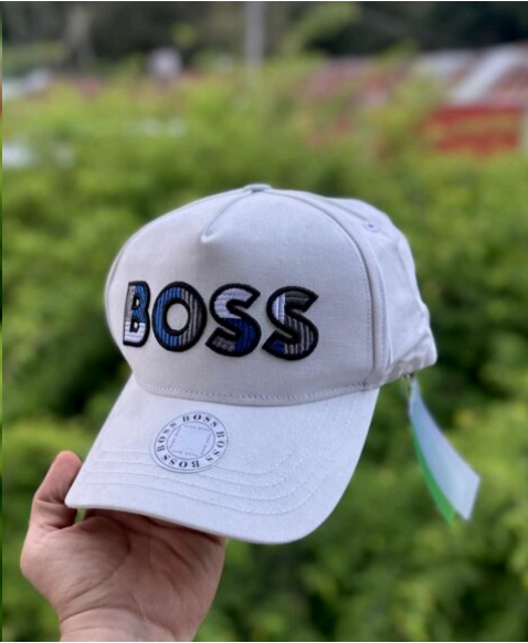
Gorra Hugo BOSS Blanca