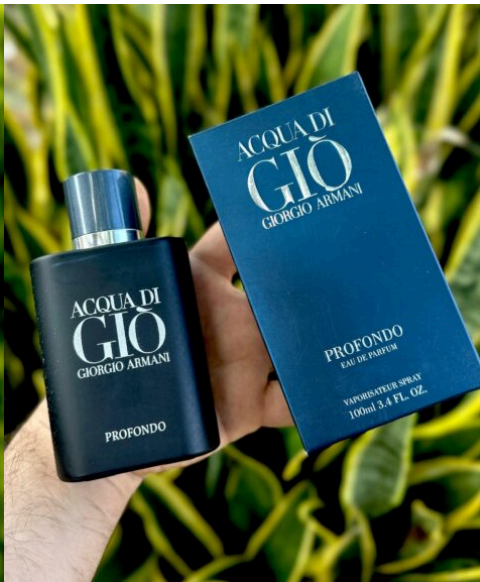
Perfume Acqua Di Giò Profondo