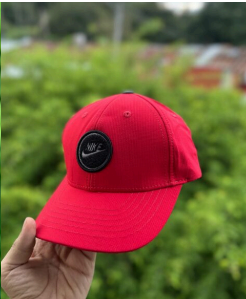
Gorra Nike Roja