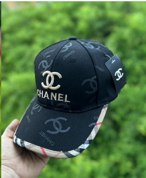
Gorra Chanel NegraDorado