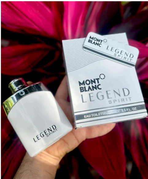
Perfume Montblanc Legend Spirit