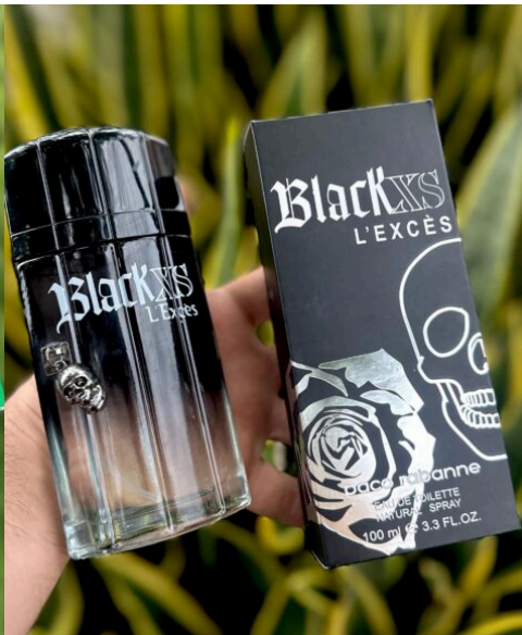
Perfume Blackx's L'excès