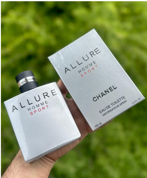
Perfume Allure Home Sport