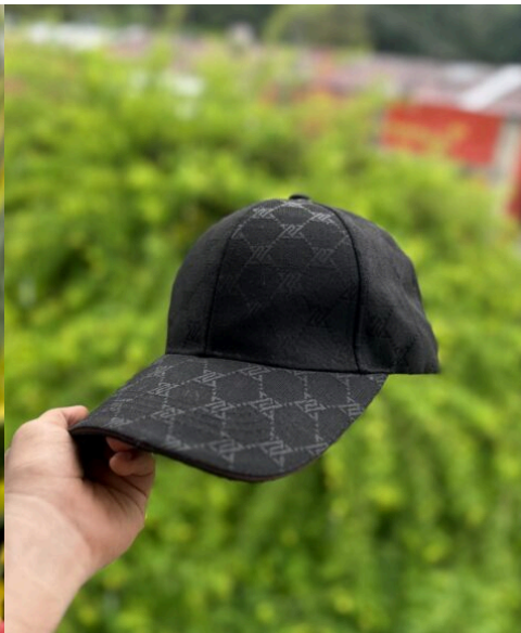
Gorra LV all black