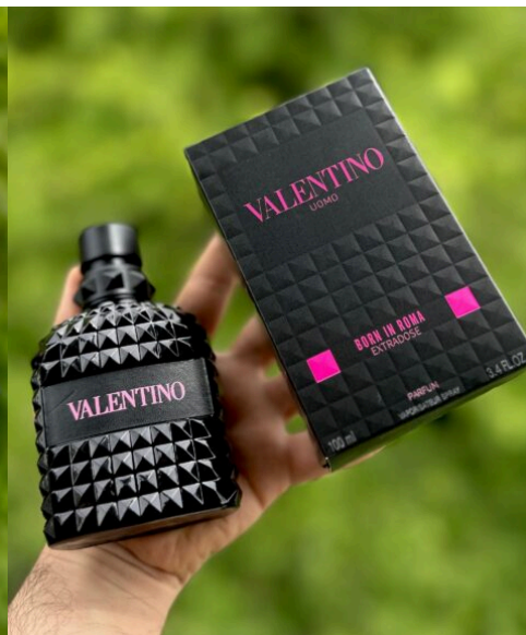
Perfume Valentino Extradose