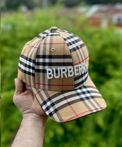
Gorra Burberry Coñak