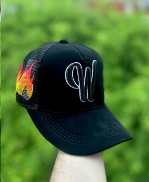
Gorra W Merch Fuego