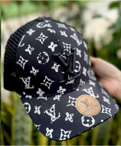
Gorra LV Sticker